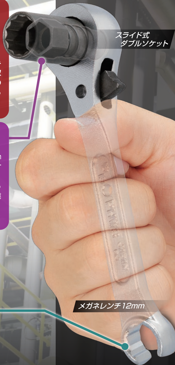
スライド式 ダブルソケット

手のひらサイズのショートタイプ! 更にソケット片側のみでの為、狭く込み入った空調内でも取り回しやすく自らの手の一部と錯覚する使い心地です。